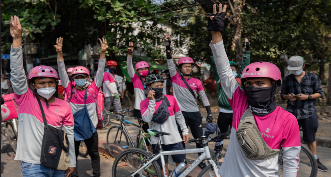
ဖေဖော်ဝါရီလ၊ ၈ရက်၊ ၂၀၂၂ ခုနှစ် လှည်းတန်း တွင်ပြုလုပ်ခဲ့သည့် ဆန္ဒပြပွဲမှ Food Panda ဝန်ထမ်းများ လက်(၃)ချောင်းထောင်နေပုံ။

၂၀၂၂ ခုနှစ်၊ မတ်လလယ်မှစ၍ Food Panda ကုမ္ပဏီမှ Food Panda rider များအပေါ် ခေါက်ကြေးများ လျှော့ချခြင်း၊ ခေါင်းပုံဖြတ်ခြင်းတို့ကြောင့် rider များမှ အလုပ်မဆင်းဘဲ သပိတ်မှောက်ခဲ့ကြသည်။ Food Panda rider များမှ ကုမ္ပဏီအား အချက် (၈) ချက်တောင်းဆိုခဲ့ပြီး ၎င်းတို့မှာ အနည်းဆုံးလုပ်အားခငွေအား (၆၇၀) ကျပ်မှစတင်ပြီး ပို့ဆောင်ရမည့်ခရီးအကွာအဝေးအပေါ် မူတည်၍ တိုးမြှင့်ပေးရန်၊ အဆင့်သတ်မှတ်ချက်နှင့် အညီတိုးမြှင့်ပေးရန်၊ ကွန်ပျူတာဆော့ဖ်ဝဲစနစ်ဖြင့် ထိန်းချုပ်ထားသည့် စည်းကမ်းများအား လျှော့ချရန်၊ rider များ၏ လုပ်ငန်းခွင်အတွင်း ထိခိုက်နစ်နာမှုများရှိပါက ကုမ္ပဏီမှတာဝန်ယူဆောင်ရွက်ပေးရန်၊ တစ်ပတ်လျှင်တစ်ရက် အပြည့်အဝ နားခွင့်ရရန်၊ ခရီးအကွာအဝေးသတ်မှတ်ရာတွင် Google Map ဖြင့်တိုင်းတာ၍ သယ်ယူသွားလာရသည့် အကွာအဝေးတွက်ချက်မှုများကိုလည်း Google Map အတိုင်းတွက်ချက်ပေးရန်၊ ကုမ္ပဏီမှ ထုတ်ပြန်လိုသည့် အကြောင်းအရာများအား တရားဝင်သတ်မှတ်ထားသည့် Social Media နှင့် Telegram Channel များမှတစ်ဆင့် တစ်ပတ်ကြိုတင် ထုတ်ပြန်ပေးရန်၊ ပြဿနာတစ်စုံတစ်ရာ ပေါ်ပေါက်လာပါက ကုမ္ပဏီနှင့် တိုက်ရိုက်ဆက်သွယ်နိုင်မည့် HotLine ဖုန်းနံပါတ်ထားရှိပေးရန်နှင့် Riders သက်သေခံကဒ်များ ထုတ်ပေးရန်တို့ဖြစ်သည်။ ၅ စစ်အာဏာသိမ်းပြီးနောက်ပိုင်း စစ်တပ်မှ ရမ်းသမ်းဖမ်းဆီးမှုများတွင် Food Panda rider များလည်း ပါဝင်ခဲ့ပြီး မှားယွင်းဖမ်းဆီးခံရခြင်း၊ ရိုက်နှက်ခံရခြင်းနှင့် ထောင်ချခံရခြင်းများအပြင် customer များ၏ ပစ္စည်းများအားလည်း အကြမ်းဖက်လက်နက်ပြု လုယူခံရခြင်းများ ကြုံတွေ့ရကြောင်း တွေ့ရသည်။