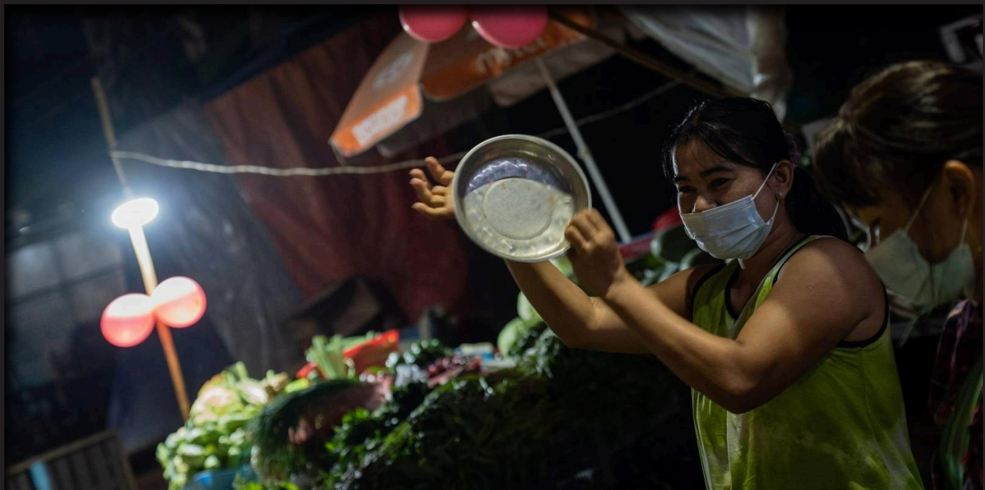
၂၀၂၁၊ ဖေဖော်ဝါရီ လဆန်းပိုင်း ကမာရွတ်မြို့နယ်မှ သံပိုးတီးနေသောဈေးသည်တစ်ဦး။

“ဒီ ၂၀၂၁၊ ၂၀၂၂ အကူးအပြောင်းလောက်မှာ စပြီးတော့မှ စစ်တပ်က ဗျူဟာနည်းနည်းပြောင်းလာတယ်။ ဘာလဲဆိုတော့ ဒီဆန္ဒပြပွဲတွေကို ဖိနှိပ်တဲ့အစား သူတို့ကဘာလုပ်လဲဆိုတော့ ဆန္ဒပြပွဲတွေကို ဖိနှိပ်ဖို့