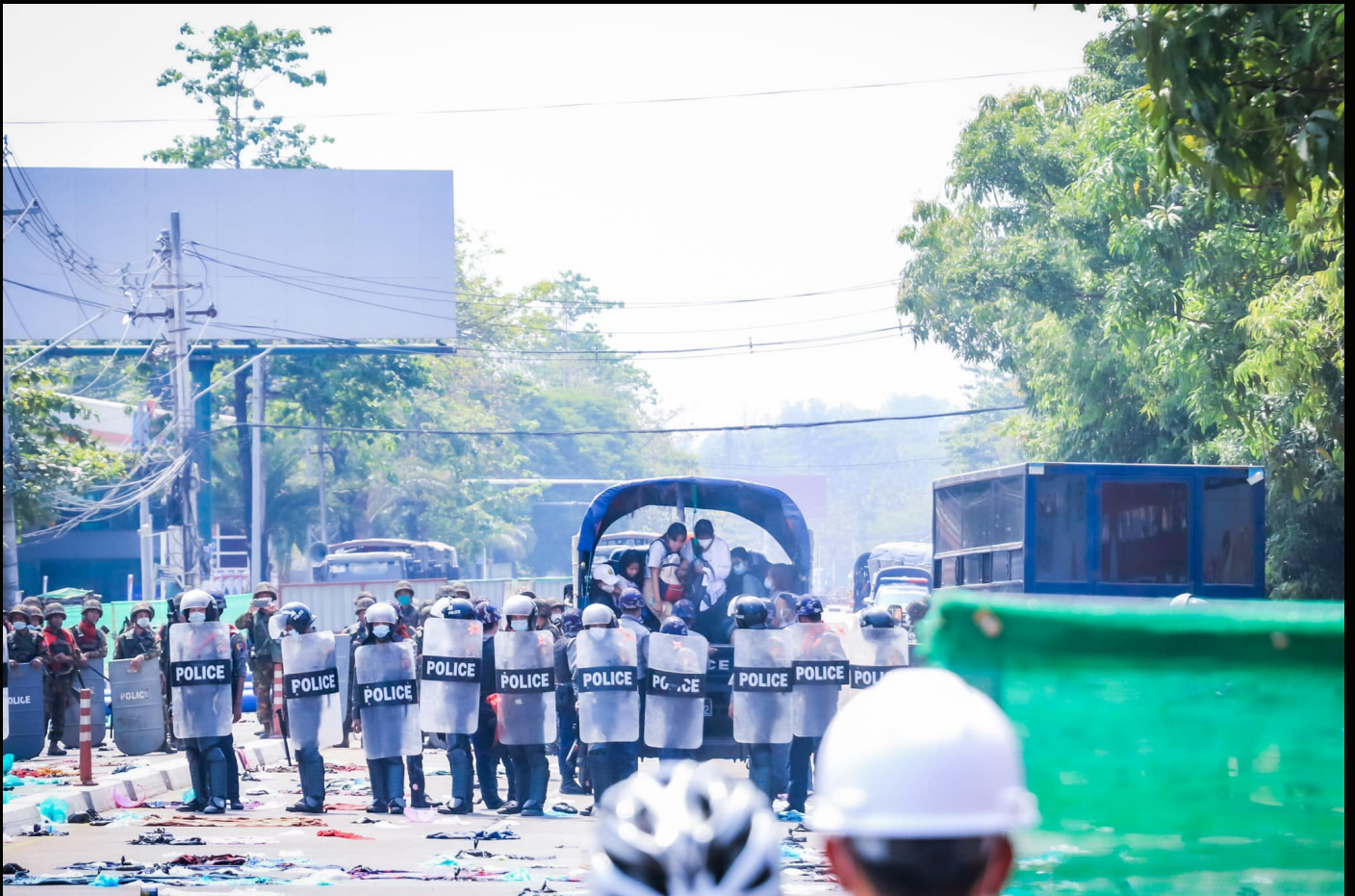
မတ်လ (၃)ရက်နေ့တွင် ရန်ကုန်မြို့၊ မြောက်ဥက္ကလာပမြို့နယ်၌ ဆန္ဒပြမှုအားအကြမ်းဖက်ဖြိုခွင်းပြီး အမျိုးသမီးများအား မတရားဖမ်းဆီးထားပုံ

သာမန်လူများအတွက် အကြမ်းဖက်စစ်တပ်၏ ရိုင်းစိုင်းယုတ်မာမှုများကို စကားလုံးများဖြင့် တိုင်းတာဖော်ပြရန်ပင် မသင့်လျော်သည့်အခြေအနေတရပ်ကို ရောက်ရှိလာပြီဖြစ်သည်။ မည်မျှပင် စစ်အုပ်စုသည် အကြမ်းဖက်ရန်လိုသည့် နည်းနာများကို ထုတ်သုံးလာသည်ဖြစ်စေ ပြည်တွင်းပြည်ပ နယ်ပယ်အသီးသီးရှိ အမျိုးသမီးတို့နှင့် LGBTQIA + အင်အားစုများသည် တွန့်ဆုတ်ရပ်တန့်သွားခြင်းမရှိသည်မှာ ဤ ၂၀၂၁ ခုနှစ် အာဏာသိမ်းမှုနှင့်အတူ မြန်မာ့နေ့ဦးတော်လှန်ရေး၏ စစ်မှန်သည့်လွတ်မြောက်ရေးအတွက် တိုက်ပွဲဝင်စိတ်ဝိဉာဉ်ကို ထင်ဟပ်စေသည်ဟု ပြောရပေမည်ဖြစ်သည်။