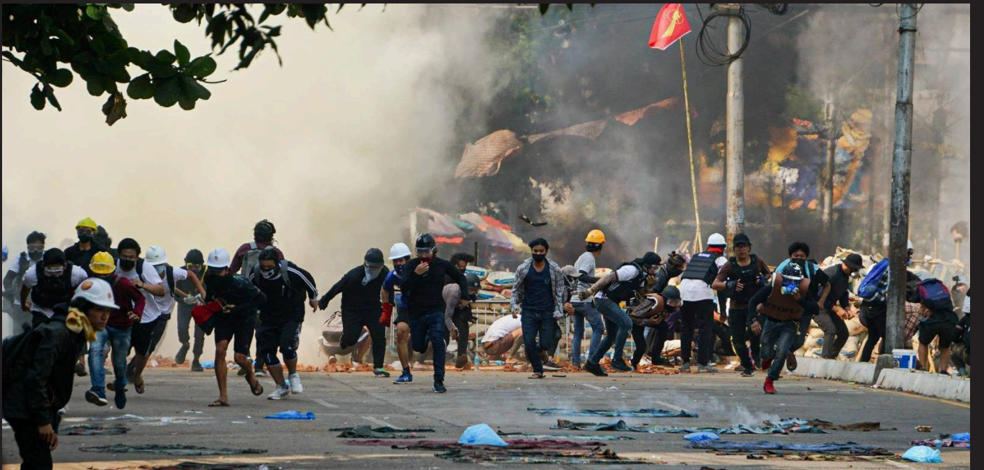
ဆန္ဒပြနေသူများအား လုံခြုံရေးတပ်ဖွဲ့ဝင်များမှ မျက်ရည်ယိုဗုံးများ၊ မီးခိုးဗုံးများဖြင့် ဖြိုခွင်းသဖြင့် ထွက်ပြေးနေပုံ။ မတ် ၁၇၊ ၂၀၂၂။