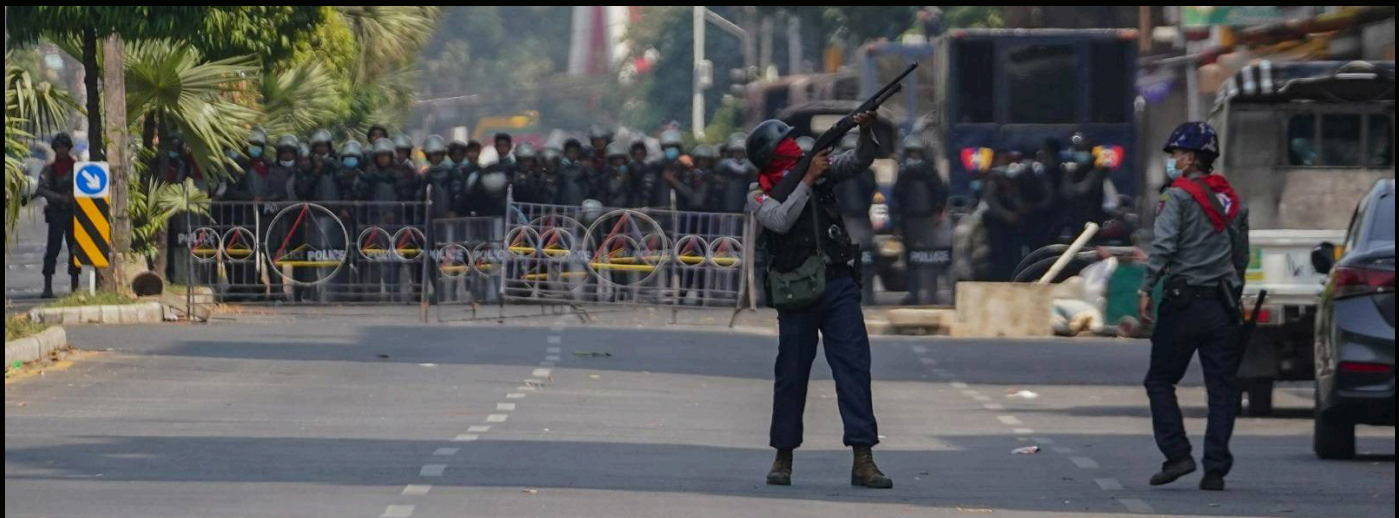
စမ်းချောင်းမြို့နယ် မှ ဖြိုခွဲခြင်းမှုအပြီး ဆန္ဒပြနေသူများ ပုန်းအောင်းနေသည့် တိုက်ခန်းများအတွင်းသို့ ပစ်ခတ်နေသည့် လုံခြုံရေး တပ်ဖွဲ့ဝင်တစ်ဦး။ မတ်လလယ်၊ ၂၀၂၁။

ထိုဥပဒေများအား ရပ်ဆိုင်းလိုက်သည့်အခါ စစ်တပ်သည် နိုင်ငံရေးတက်ကြွလှုပ်ရှားသူများ၊ ဆန္ဒပြပြည်သူများ၊ အမိန့်ဖိဆန်ရေးလှုပ်ရှားမှု (CDM) တွင် ပါဝင်သူများအား ထင်သလို အိမ်ထဲဝင်ရောက်၍ ဖမ်းဆီးခြင်းများရှိသကဲ့သို့ ဆန္ဒပြပွဲများတွင် ဖြိုခွဲခြင်းများကြောင့် ပုန်းအောင်းခိုလှုံနေရသော လူငယ်များ၊ လက်ခံသော အိမ်ရှင်များအား ထင်သလို ဝရမ်းမပါဘဲ အတင်းအဓမ္မ ဝင်ရောက်ဖမ်းဆီးခြင်းများရှိလာခဲ့သည်။ ထို့ပြင်ပုဂ္ဂိုလ်ရေးဆိုင်ရာ နောက်ယောင်ခံလိုက်ခြင်းများ၊ ဆက်သွယ်ရေးကိရိယာကို အသုံးပြု၍ ဆက်သွယ်သောအခါ ကြားဖြတ်ဖမ်းယူ နားထောင်ခြင်းများ၊ ဆက်သွယ်ရေး အော်ပရေများထံမှ ပုဂ္ဂိုလ်ရေးဆိုင်ရာ အချက်အလက် အဓမ္မတောင်းခံခြင်းများ၊ စာအိတ်၊ ပါဆယ်ထုတ်များအား ဖွင့်ဖောက်ခြင်း၊ ရှာဖွေခြင်းများ၊ မိသားစုရေးရာကိစ္စများတွင်လည်း ယောက်ျားဖြစ်သူကို ဖမ်းမိသောအခါ ဇနီးနှင့် သားသမီးများအား ဘေးစားခံ ဖမ်းဆီးခြင်းများ၊ နိုင်ငံသားများ၏ ပိုင်ဆိုင်မှုများအား သိမ်းယူခြင်း၊ ချိတ်ပိတ်ခြင်းများအား လုပ်ဆောင်လာခဲ့သည်။