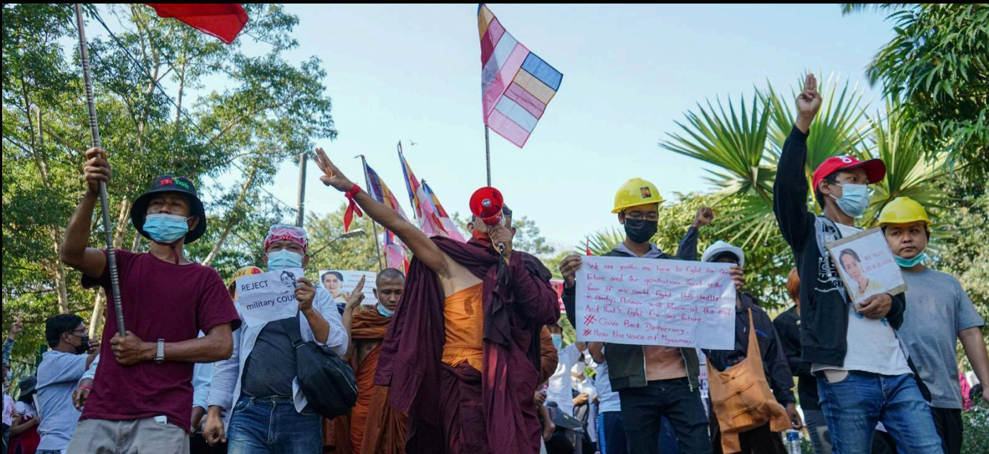
စစ်တပ်ရဲ့ အာဏာသိမ်းမှုကို ဆန့်ကျင်သော ဆန္ဒပြ သပိတ်စစ်ကြောင်းတခုကို ဖေဖော်ဝါရီလ ၁၀ ရက်နေ့ ၂၀၂၁ က ရန်ကုန်မြို့၊ ကုလသမဂ္ဂ ရုံးအနီးတွင် တန်းစီးလှည့်လည် ဆန္ဒပြနေပုံ။