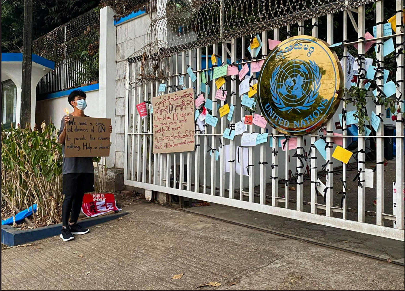
ဖေဖော်ဝါရီ၊ ၂၀၂၁ ခုနှစ် ရန်ကုန်မြို့ကုလသမဂ္ဂ ရုံးရှေ့တွင် ကုလသမဂ္ဂ၏မြန်မာ့အရေးပါဝင်ပတ်သက်မှုကို ဆန္ဒပြနေသူတစ်ဦး။