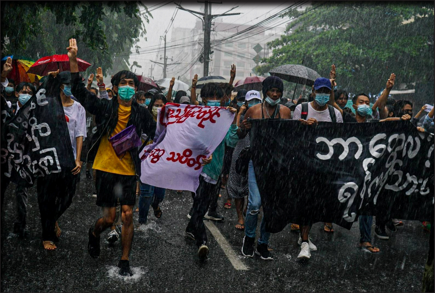
ရန်ကုန်မြို့၊ ပြောက်ကျားသပိတ်တစ်ခု

လေ့လာတွေ့ရှိချက်များအရ မတ်လအတွင်း ငြိမ်းချမ်းစွာဆန္ဒပြသူ ပြည်သူများအား အကြမ်းဖက် သတ်ဖြတ်၊ ဖမ်းဆီးခြင်းများကို စစ်အာဏာရှင်လက်အောက်ခံ အကြမ်းဖက်စစ်သားနှင့် ရဲများမှ အများဆုံးကျူးလွန်ခဲ့သော်လည်း မတ်လအကုန်ဧပြီလဆန်းပိုင်းထိ သန်းနှင့်ချီသောပြည်သူထုတရပ်လုံး၏ ငြိမ်းချမ်းစွာဆန္ဒထုတ်ဖော်ပွဲများ၊ သပိတ်ပွဲများကို နိုင်ငံအနှံ့ ကျယ်ကျယ်ပြန့်ပြန့်တွေ့ရှိရသည်။ ထို့နောက် မတ်လ (၂၇) ရက် နောက်ပိုင်းမှစ၍ စစ်တပ်၏ ရက်စက်သော အကြမ်းဖက်ဖြိုခွင်းမှုများကြောင့် လူထုဆန္ဒထုတ်ဖော်သည့်သပိတ်များ လျော့နည်းလာပြီး မြို့ပြပြောက်ကျားသပိတ်များ စတင်လာခဲ့သည်။ “မတ်လ ၂၉ ရက်နေ့နောက်ပိုင်းမှာ မြို့နယ်အထိုင်သပိတ်တွေ အကုန်လုံးဖြိုခဲရပြီးတဲ့ နောက်ပိုင်းမှာ ကျွန်တော်တို့ ပြောက်ကျားသပိတ်တွေစပြီး ပုံဖော်ခဲ့ကြတယ်။ အဲဟာကို ဧပြီလ(၃၀) ရက်နေ့မှာ စပြီးတော့ ပုံဖော်ခဲ့ကြတယ်” ဟု မြို့ပြပြောက်ကျားသပိတ်များတွင် ဦးဆောင်ပါဝင်လျက်သော သပိတ်ခေါင်းဆောင် လူငယ်တစ်ဦးမှ ဖြေဆိုခဲ့သည်။ ထို့အပြင် သပိတ်ကော်မတီအဖွဲ့ဝင်တစ်ဦးမှလည်း ပြောက်ကျားသပိတ်များ စတင်ဖြစ်ပေါ်လာခဲ့ပုံနှင့် ယနေ့အချိန်တိုင် အာဏာသိမ်းခြင်းအားဆန့်ကျင်သည့် လူထုဆန္ဒထုတ်ဖော်သော ပြောက်ကျားသပိတ်များ ဆက်လက် ပြုလုပ်နေလျက်ကြောင်း ပြောကြားခဲ့သည်။