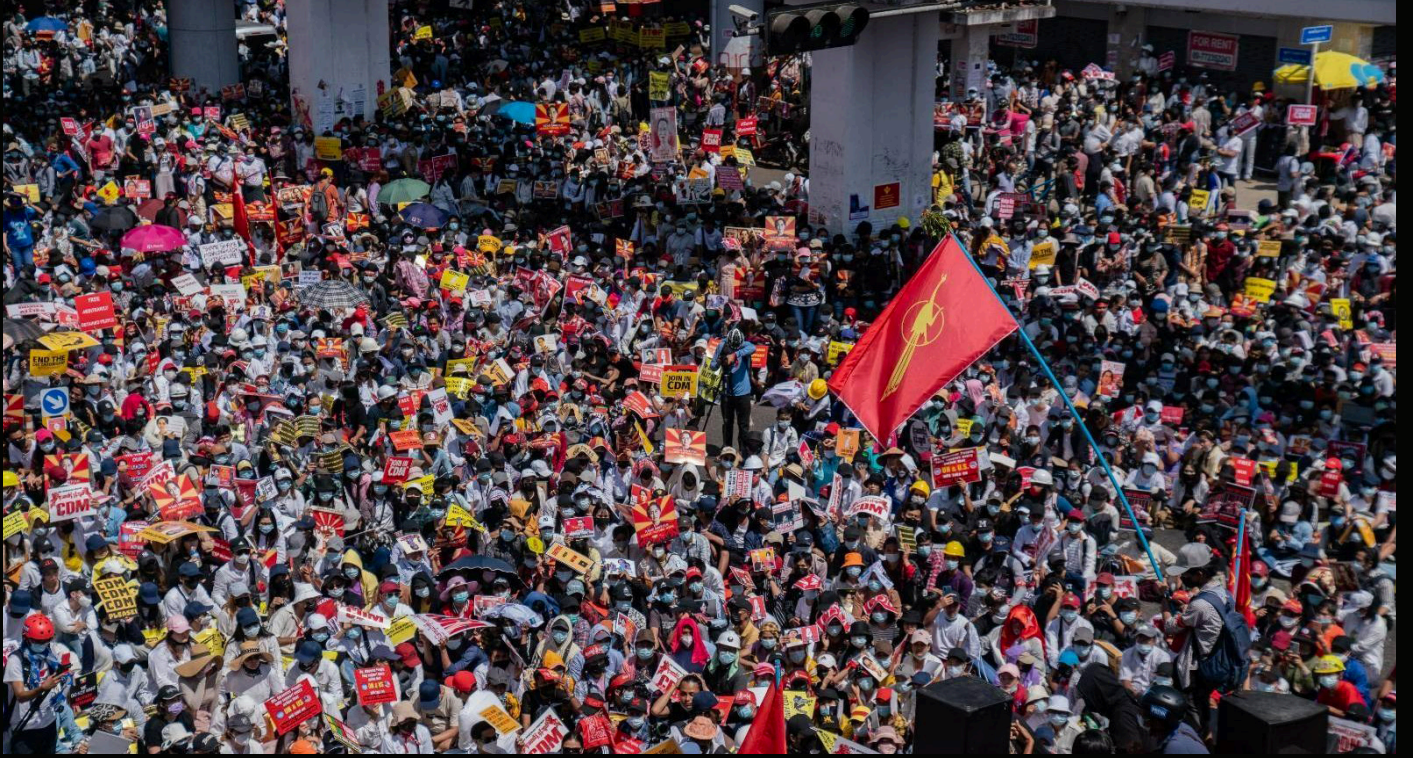
ဖေဖော်ဝါရီ ၂၂၊ ၂၀၂၁၊ ဆူးလေ၊ (၂) ငါးလုံးနေဆန္ဒပြပွဲ။

စစ်အုပ်စု၏ ပြည်သူ့အာဏာကိုမတရားသဖြင့် သိမ်းယူမှုအား နယ်ပယ်အသီးသီးမှ နိုင်ငံ့ဝန်ထမ်းများက နည်းလမ်းပေါင်းစုံဖြင့် ဆန့်ကျင်တော်လှန်ခဲ့ကြပေသည်။ စစ်အာဏာရှင်စနစ်ဆန့်ကျင်သည့် သံပိုးတီးကမ်ပိန်းကို ၂၀၂၁ ခုနှစ်၊ ဖေဖော်ဝါရီလ (၂) ရက်နေ့တွင် စတင်ခဲ့ပြီး ဖဲကြိုးနီကမ်ပိန်းကို ဖေဖော်ဝါရီလ (၃) ရက်နေ့တွင် စတင်လှုပ်ရှားခဲ့ကြသည်။