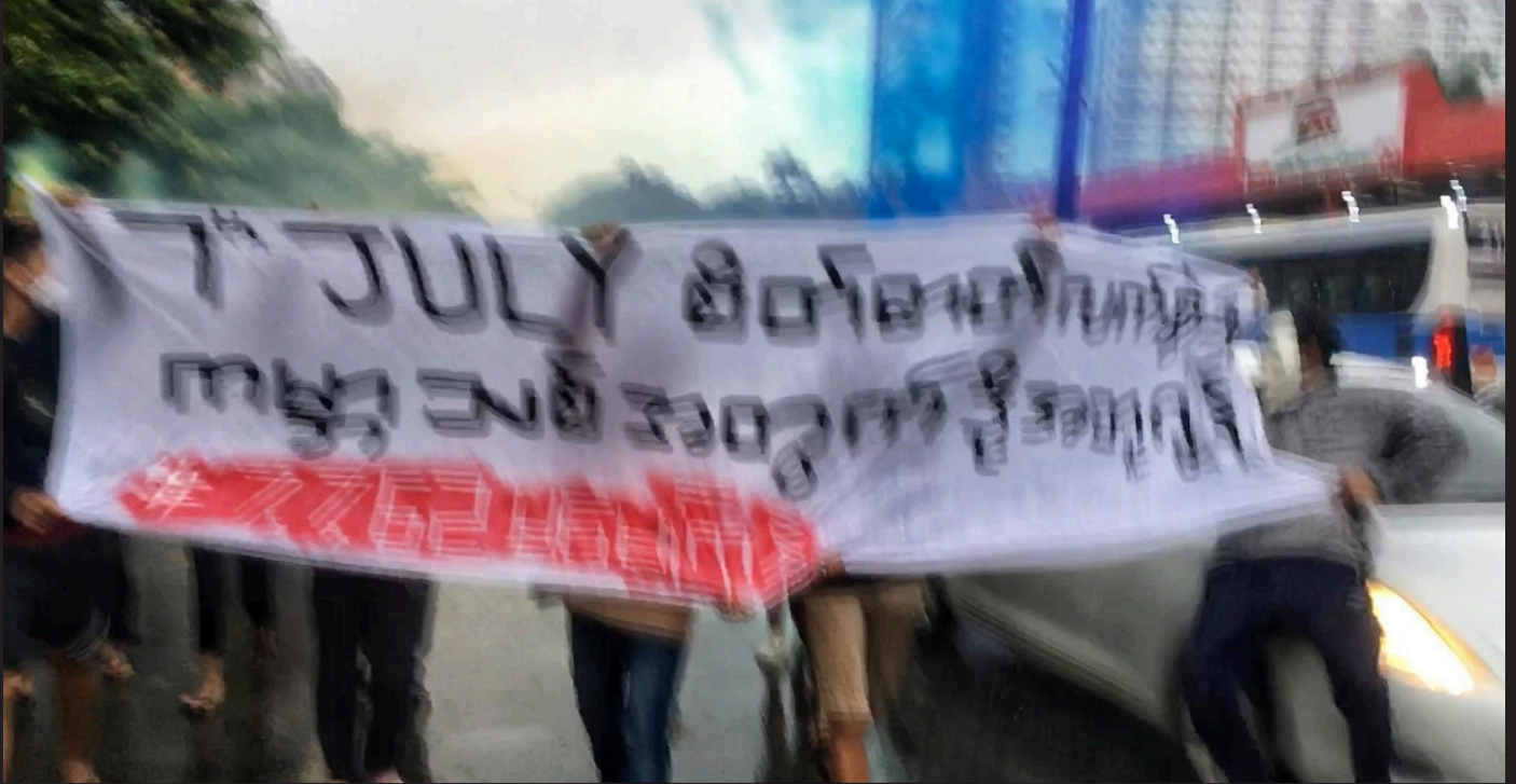
7 July အထိမ်းအမှတ်ဆန္ဒပြသူများကို စစ်တပ်က အရပ်သားအသွင်ယူပြီး အိမ်စီးကားဖြင့်ဝင်တိုက်သည့်ပုံ။ ဂျူလိုင် ၇၊ ၂၀၂၂။

အကြမ်းဖက်စစ်တပ်မှ အာဏာသိမ်းပြီးကာလအစောပိုင်းတွင် ၎င်းတို့ကို ဆန့်ကျင်သော လူထုလှုပ်ရှားမှုများ၌ ပါဝင်သော ပြည်သူများကို နည်းအမျိုးမျိုးဖြင့် ဖိနှိပ်ဖြိုခွင်းကာ ရိုက်နှက်ခြင်း၊ သတ်ဖြတ်ခြင်းများ ကျူးလွန်ခဲ့ရုံသာမက ပြောက်ကျားသပိတ်များကိုလည်း ထိုနည်းတူစွာ သေနတ်များဖြင့် ပစ်ခတ်ဖြိုခွင်းခြင်း၊ အိမ်စီးကား (သို့) စစ်ကားများဖြင့် တိုက်၍ ဖြိုခွင်းခြင်းများကို ဆက်တိုက်ကျူးလွန်လာသည်။