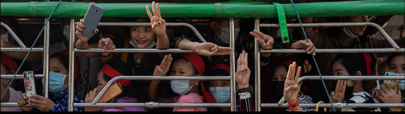
ဖေဖော်ဝါရီလ ၆ရက်၊ ၂၀၂၁ ပထမဦးဆုံး လူ့အုပ်စုလိုက် ဆန္ဒပြပွဲတွင်ပါဝင်ရန် စုရုံးနေကြသည့် အထည်ချုပ်စက်ရုံလုပ်သားများ။